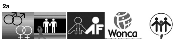
Figura 2: íconos que, de estar en la sala de espera, comunican que la calidad de la atención que se brinda en esa institución no está condicionada por la orientación y/o identidad sexual (2a) y que no lo comunican o pueden sugerir el mensaje contrario si aparecen en forma aislada (2b)

Muchos expertos de países anglosajones sostienen que las personas con orientación sexual minoritaria "escanean" visualmente las instalaciones donde son atendidos buscando pistas que los ayuden a determinar si van a sentirse cómodos compartiendo información con los profesionales con quienes se van a relacionar. Por eso y para hacer amigable el entorno, algunos consensos recomiendan que se coloque algún cartel en el que se diga que la calidad de la atención que se brinda en esa institución no está condicionada por factores como edad, raza, religión, capacidades físicas o mentales, religión, orientación y/o identidad sexual; o bien algún ícono representativo que comunique este tipo de mensaje como los que se muestran en la figura 2a, recordando que la exclusiva presencia de otros que no comunican este tipo de mensaje (ver figura 2b) puede contribuir a la sensación de segregación.